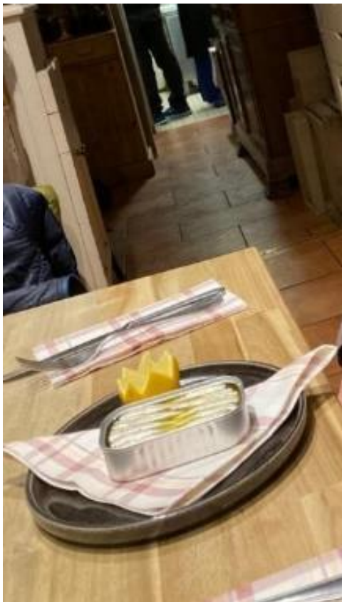
antipasto di sardine almeno originale