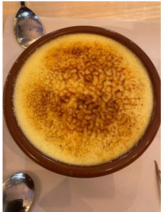
creme brulee da manuale